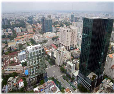
원 준 희

해외에서 인턴십을 해본다는 쉽지 않은 경험을 하게 해주신 학교 관계자 분들과 코트라 관계자 분들에게 감사드리며, 추후 후배들이 해외 인턴십을 나갈 때 많은 도움이 되었으면 좋겠습니다.