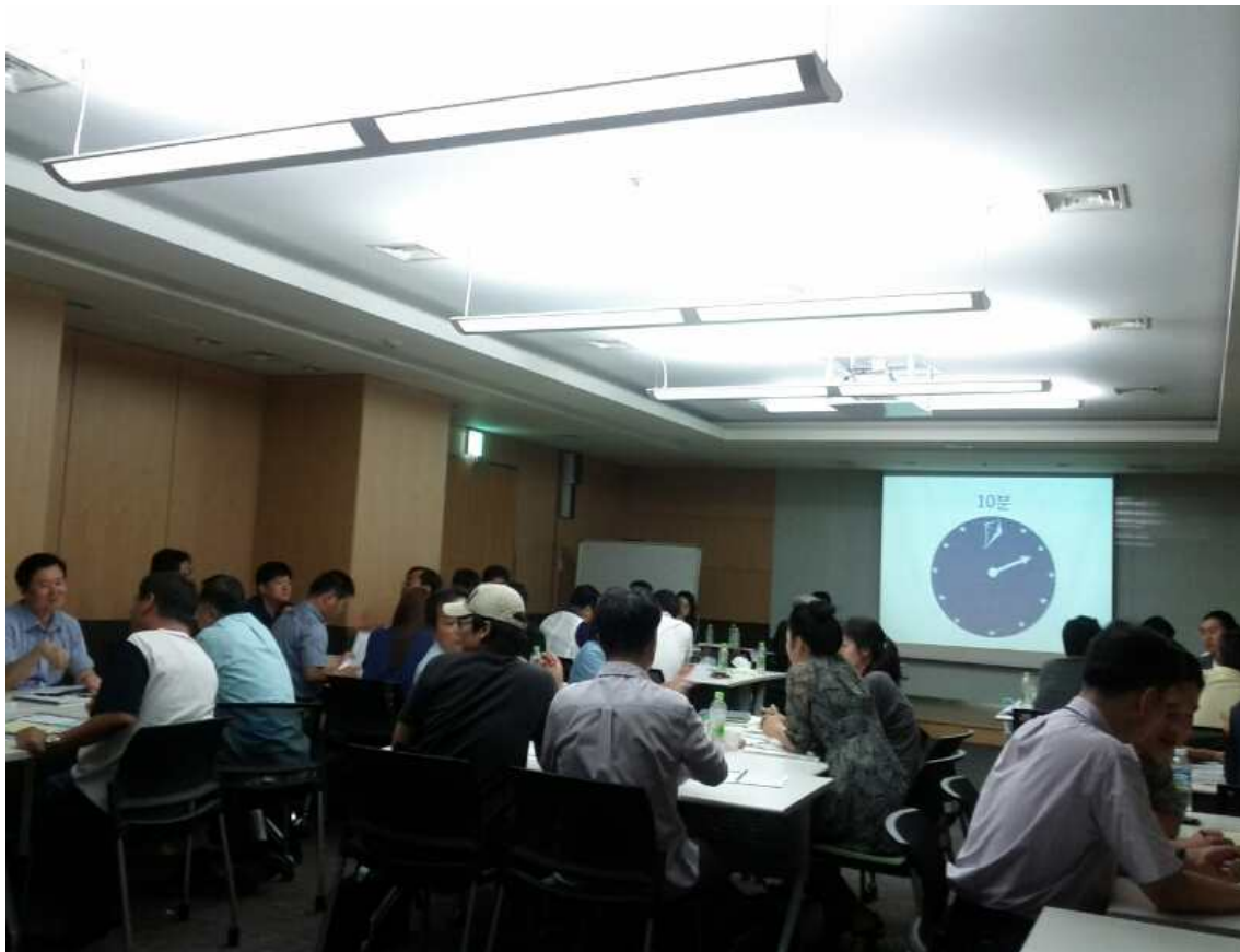
8월 25일 기술사업화 아이템 기획 강의시간에 수강생들이 조별로 아이템 기획에 골몰하고 있는 모습

이 교육은 3년 동안 진행될 예정인데, 내년에는 커리큘럼을 대폭 강화하여 기술사업화 이론, 기술가치평가, KOTRA 기술사업화 사례 및 케이스 스터디, 사업계획서 작성 및 투자유치발표 등을 4가지 교과목으로 구성하여 더욱 향상된 교육을 제공할 예정이다.