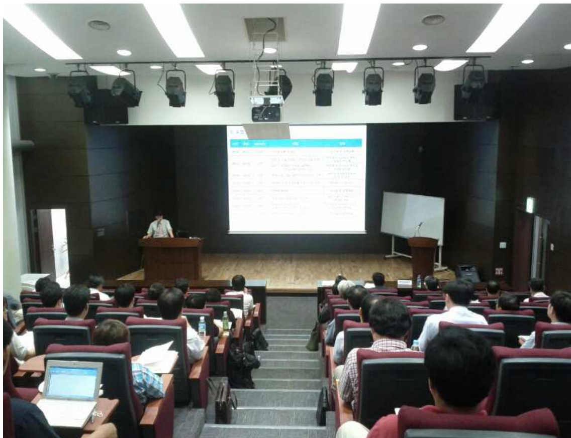
8월 18일 코트라에서 진행된 「중소기업의 글로벌 기술사업화 전문인력양성과정」 입학식이 진행되는 모습

국내 중소기업의 글로벌 기술사업화 전문인력을 양성하기 위해 지식경제부·고용노동부가 지원하고 한양대학교 컨설팅대학원이 주관하는 「중소기업의 글로벌 기술사업화 전문인력양성과정」이 KOTRA에서 진행되고 있다. 이 교육은 KOTRA·테크노베이션파트너스가 협력기관으로 참여하여 교육운영을 같이 진행하고 있다.