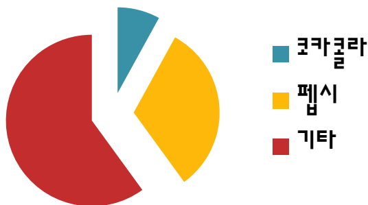
베트남 내 음료시장 점유율(2016년 기준)