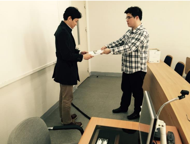
OJT 결과물을 배부하는 모습 상장을 수여하는 듯한 느낌이 듭니다.