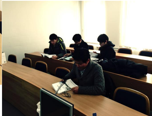
OJT 결과물을 받은 모습 그간의 노력을 결과물로 받아 보니 뿌듯합니다.