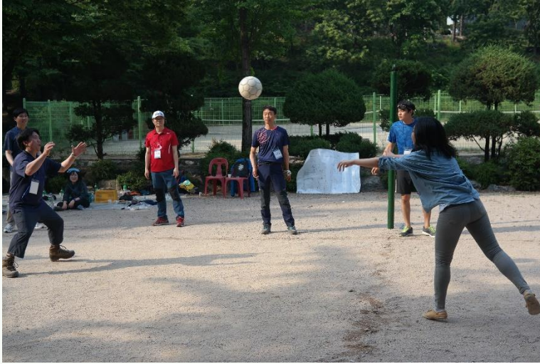
◀ 피구 대회