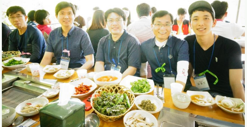
운중농원에서 점심식사 ▶