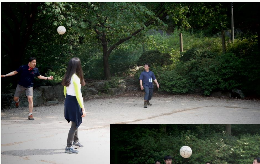
◀▼ 족구 대회