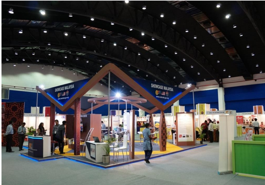
India - Malaysia Expo