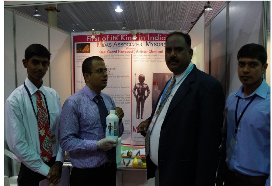
IE-TECH Industrial & Engineering technology expo